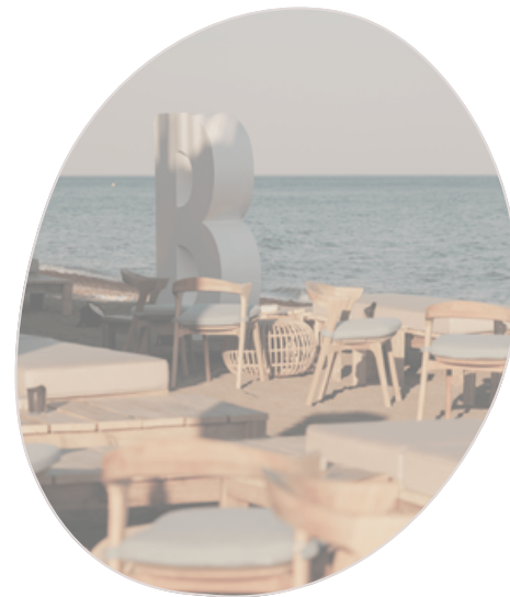
Beso Beach Estepona