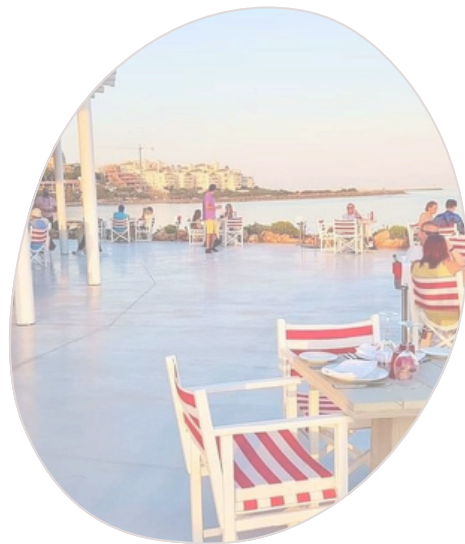
Ancla Sea Bridge