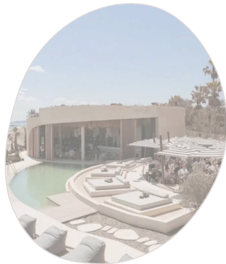
Nido Beach Club