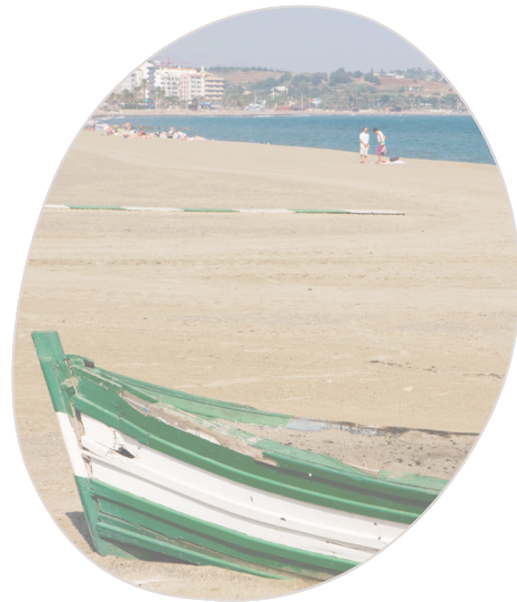
Rada Beach Estepona