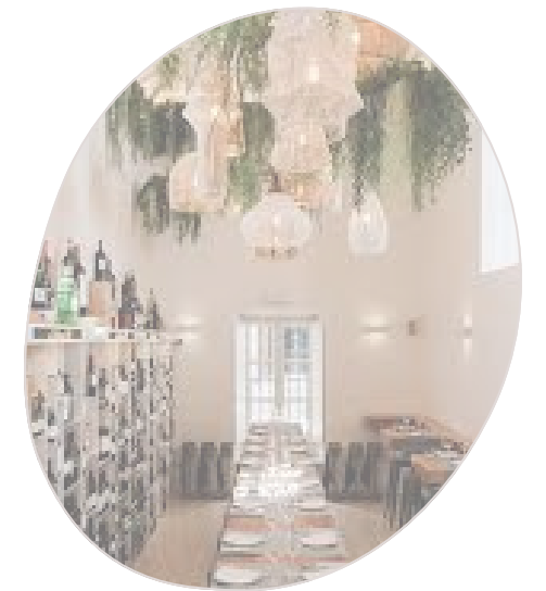
La Casa del Rey