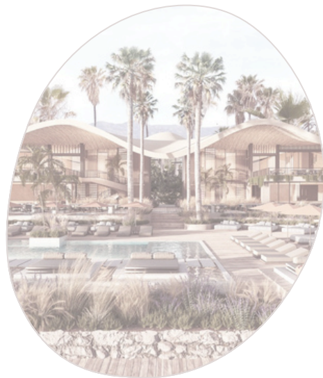
Laguna Beach Estepona