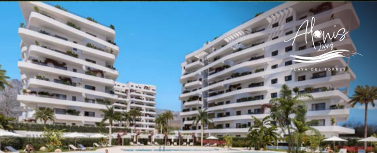
PLAYA DEL TORRES (ALICANTE).