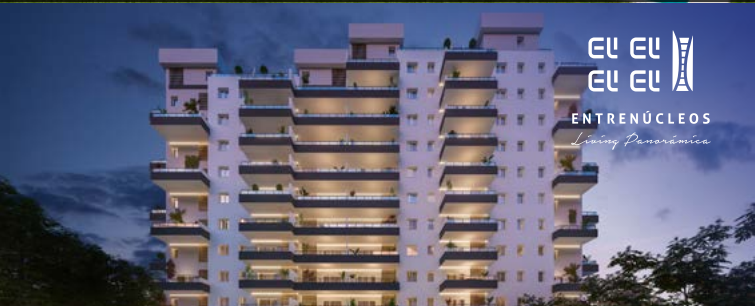
DOS HERMANAS (SEVILLA).