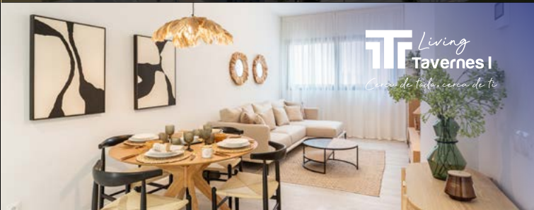
TAVERNES BLANQUES (VALENCIA).