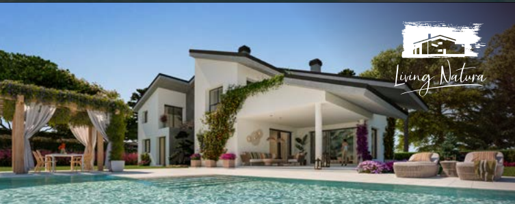
LA COLONIA DE TORRELODONES (MADRID).