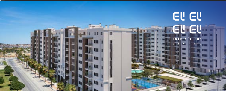
DOS HERMANAS (SEVILLA).