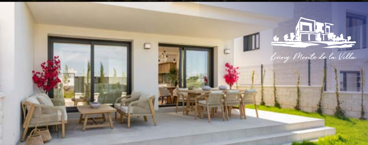
VILLAVICIOSA DE ODÓN (MADRID).